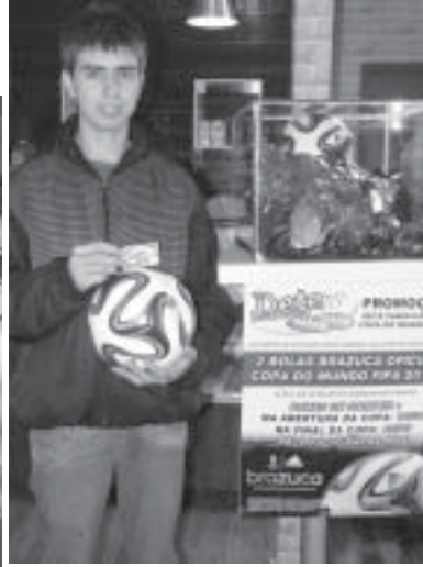
Princesa Isabel, com o cupom número 180.