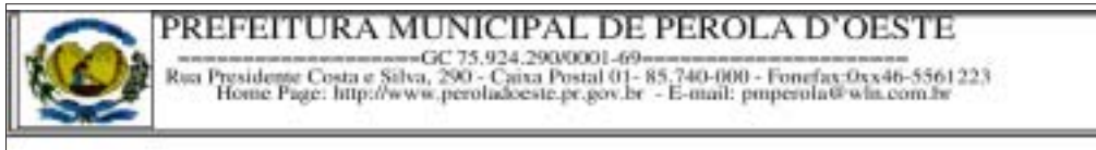
ALCIR VALENTIN PIGOSO Prefeito Municipal

PREFEITURA MUNICIPAL DE PEROLA D'OESTE GC 75.924.290/0001-69 Rua Presidente Costa e Silva, 290 - Caixa Postal 01 - 85.740-000 - Fonefax: 0xx46-5561223 Home Page: http://www.peroladoeste.pr.gov.br - E-mail: pmperola@wln.com.br