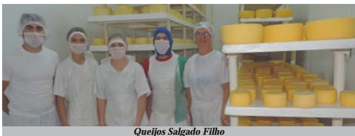
Queijos Salgado Filho