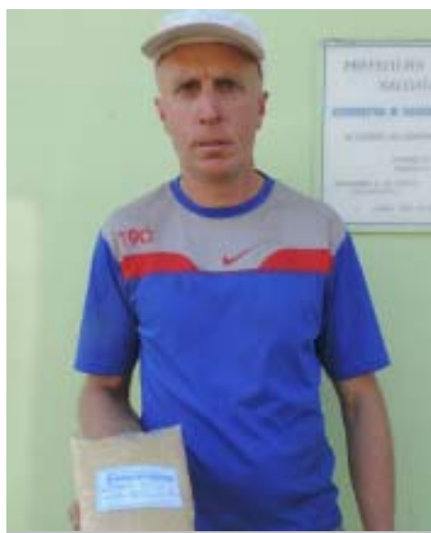
Derivados de Cana